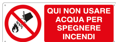
E1823K 350 x 125 mm