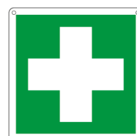
CASSETTA DI PRONTO SOCCORSO E20114X 250 x 310 mm