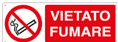
E1801K 350 x 125 mm