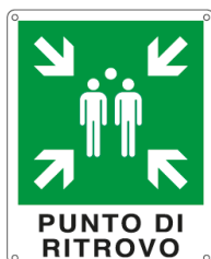
PUNTO DI RITROVO E20173X 250 x 310 mm