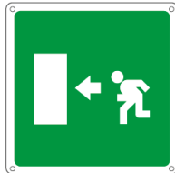
15154X 250 x 250 mm