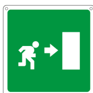
USCITA DI EMERGENZA 20106X 250 x 310 mm