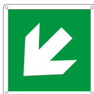
E15105X 250 x 250 mm