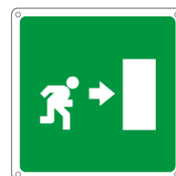
15153X 250 x 250 mm