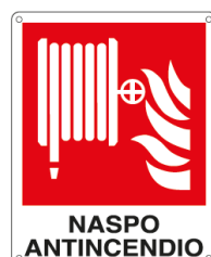
NASPO ANTINCENDIO E20168X 250 x 310 mm