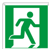
USCITA DI EMERGENZA E20106X 250 x 310 mm