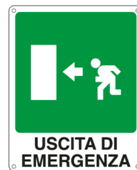
USCITA DI EMERGENZA 20105X 250 x 310 mm