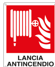
LANCIA ANTINCENDIO E20157X 250 x 310 mm