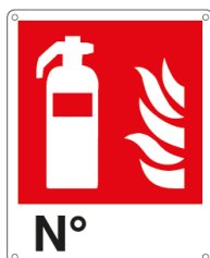
N° E20121X 250 x 310 mm