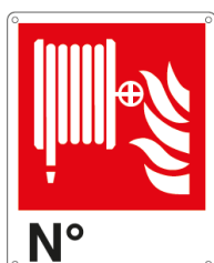
N° E20160X 250 x 310 mm