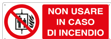
E1845K 350 x 125 mm