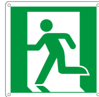
E15154X 250 x 250 mm