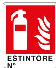
ESTINTORE N° E20150X 250 x 310 mm