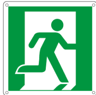
E15153X 250 x 250 mm