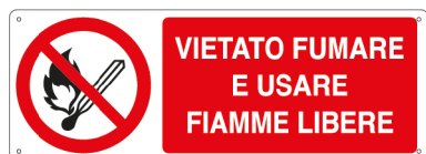
E1822K 350 x 125 mm