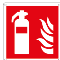
E15107X 250 x 250 mm