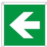
E15104X 250 x 250 mm