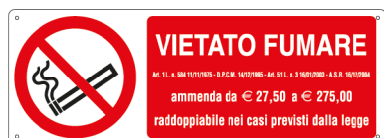
E18088K 350 x 125 mm