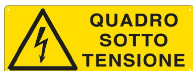
E1774K 350 x 125 mm