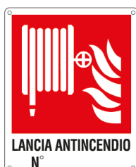
LANCIA ANTINCENDIO N° E20165X 250 x 310 mm