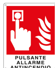
PULSANTE ALLARME ANTINCENDIO E20174X 250 x 310 mm