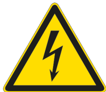
E1107K lato 140 mm

Segnaletica in alluminio a maggiore diffusione